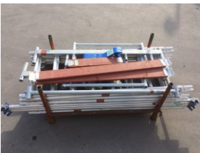
Artikel - #: 9030300054 Rollgerüst 6,26 mtr Arbeitshöhe