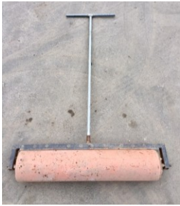
Artikel - #: 0600037 Rasenwalze