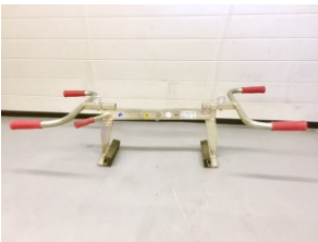
Artikel - #: Versetzzange Blockstufe