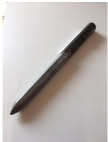
Artikel - #: 9030300011 Spitzmeisel f. 30 kg