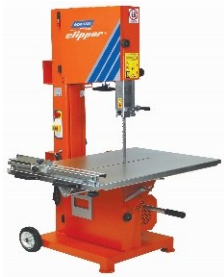
Artikel - #: 9030300087 Baustoff Bandsäge Norton ohne Band