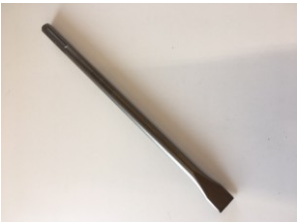
Artikel - #: 9030300056 Flachmeisel SDS Max