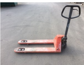
Artikel - #: 9030300068 Linde Hubwagen