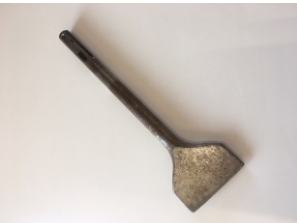
Artikel - #: 9030300005 Breitmeisel SDS Max