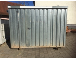
Artikel - #: 9030300044 Materialcontainer 3,00 x 2,00 mtr