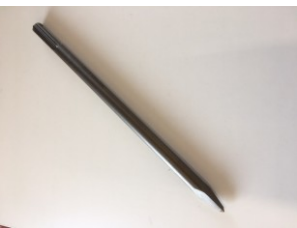
Artikel - #: 9030300062 Spitzmeisel SDS Max