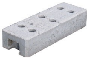
Artikel - #: 9030300118 Betonfuß für Bauzaun Einzel