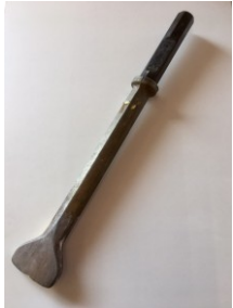
Artikel - #: 9020200083 Spatenmeisel f. 30 kg