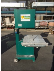
Artikel - #: 9030300050 Porenbeton Bandsäge Ohne Band