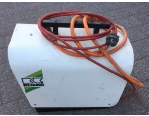
Artikel - #: 9030300078 Gasheizer