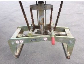
Artikel - #: 9030300016 Versetzzange Betonblöcke